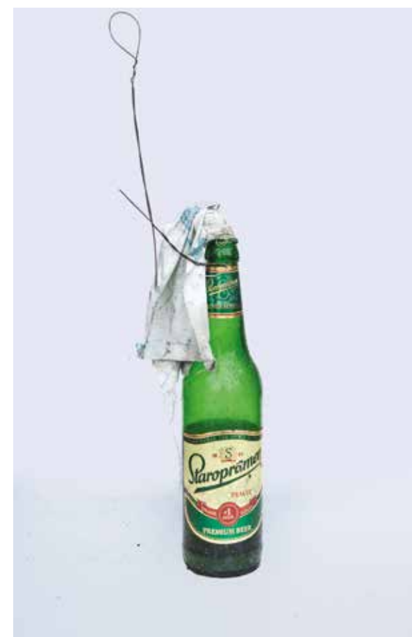
Fotógrafo: DONALD WEBER, FOTÓGRAFO DEL AÑO STILL LIFE Año: 2015