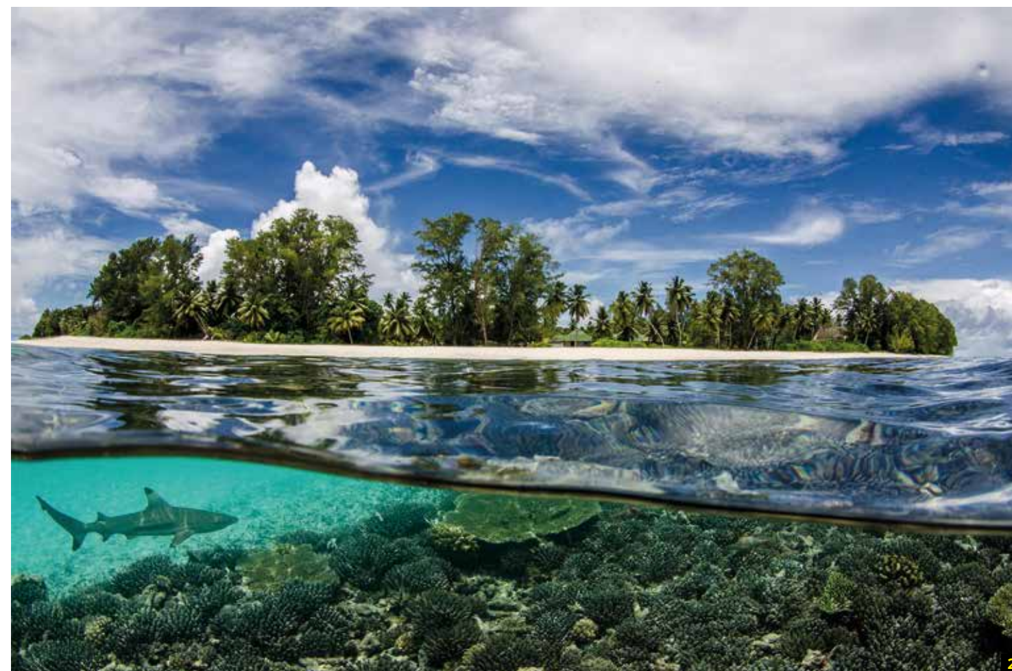
4 Autor: Auras Mihaiu. País: Rumania. Ganador de la categoría: Romania, National Award. Copyright: © T Auras Mihaiu, Winner, Romania, National Award, 2015 Sony World Photography Awards.