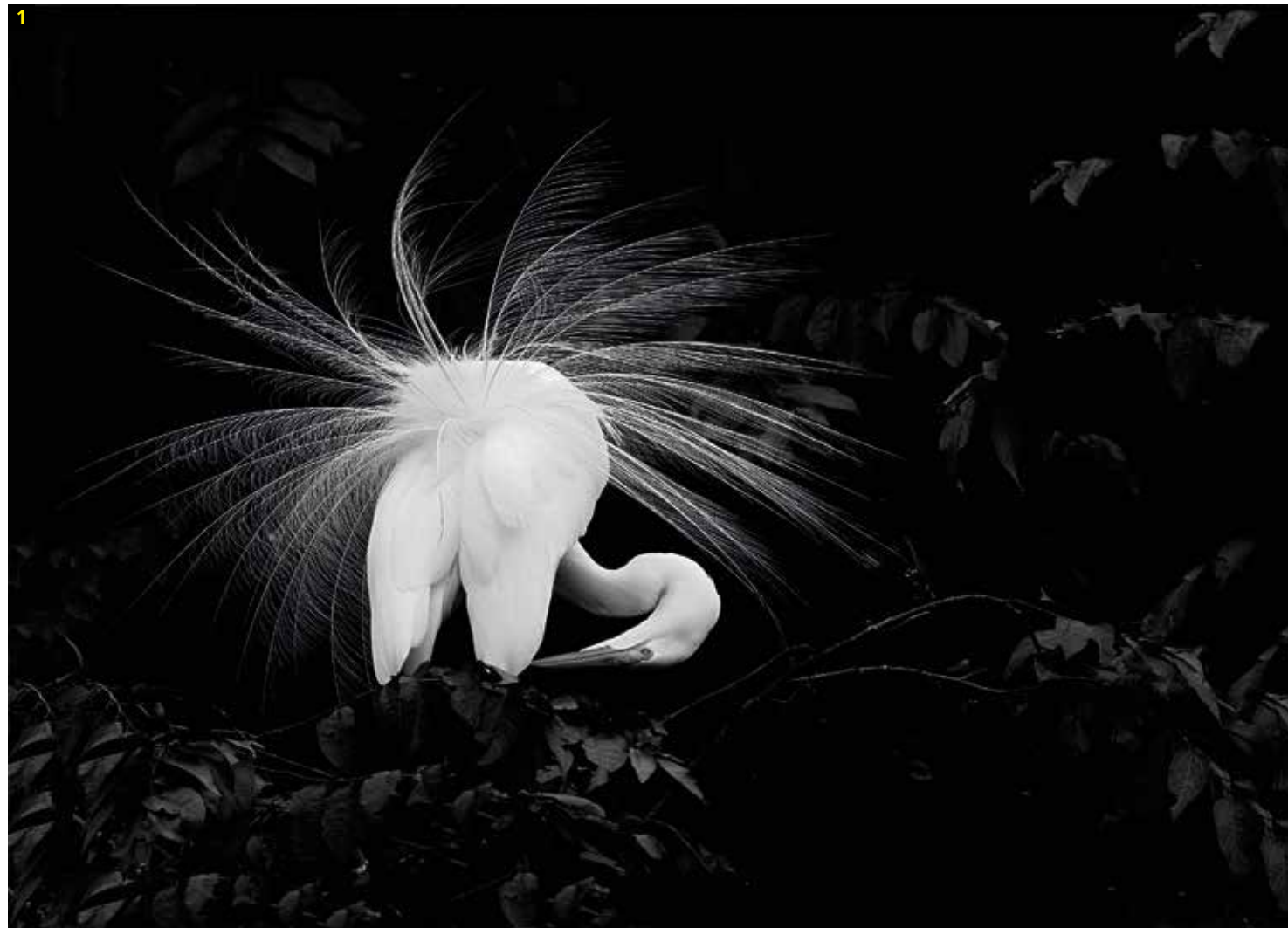
1 Fotografía: Great Egret. País: Colombia. Ganador de la categoría: ColombiaNational Award.