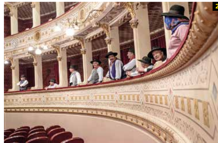
3 Fotografía: Back alley. Autor: Yong Lin Tan. País: Malasia. Ganador de la categoría: Environment, Youth Competition. Copyright: © Yong Lin Tan, Malaysia, Winner, Environment, Youth Competition, 2015 Sony World Photography Awards.