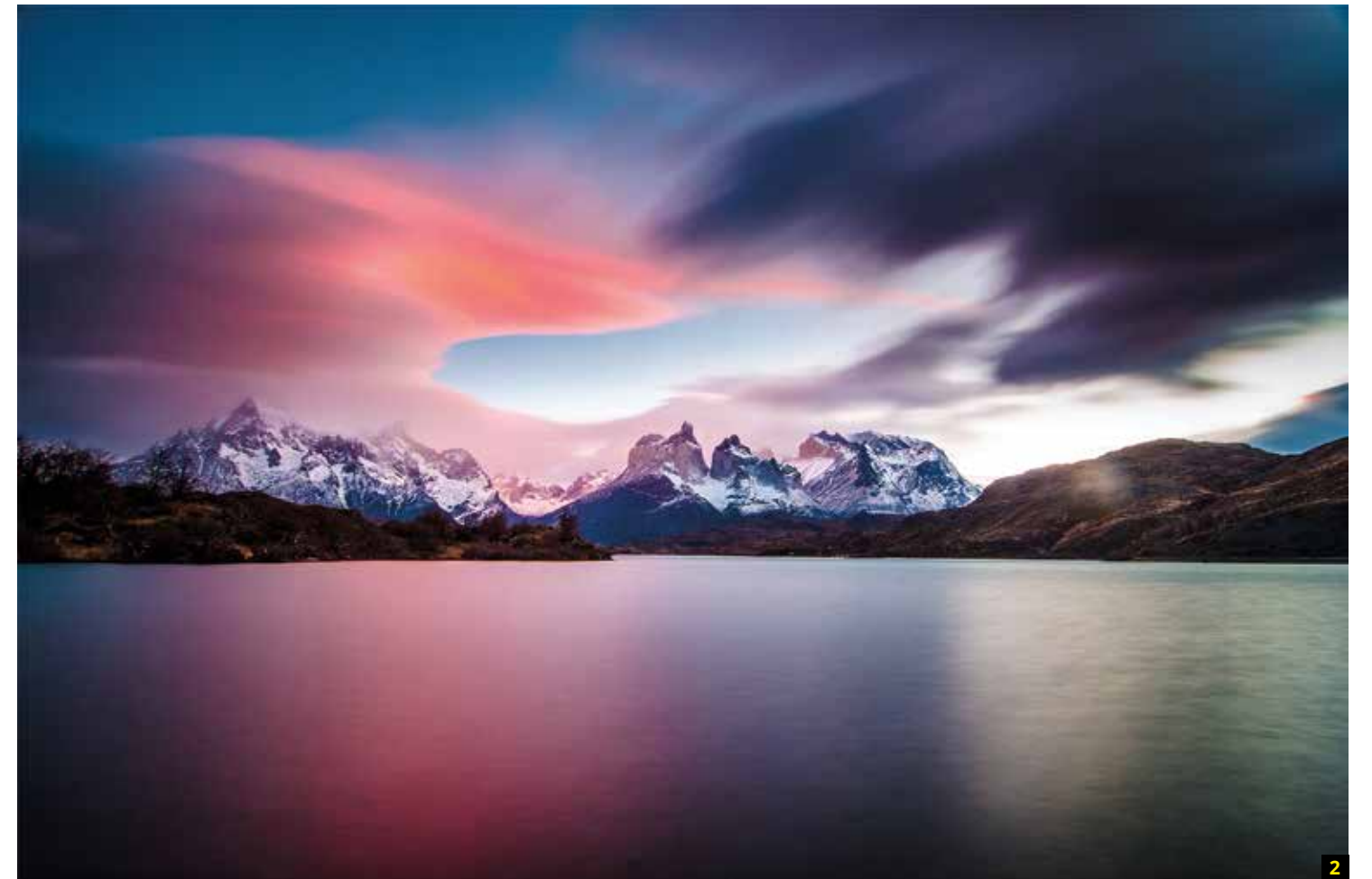
2 Fotografía: The Horns of Paine. Autor: Manuel Fuentes. País: Chile. Ganador de la categoría: Chile National Award. Copyright: © Manuel Fuentes, Winner, Chile National Award, 2015 Sony World Photography Awards