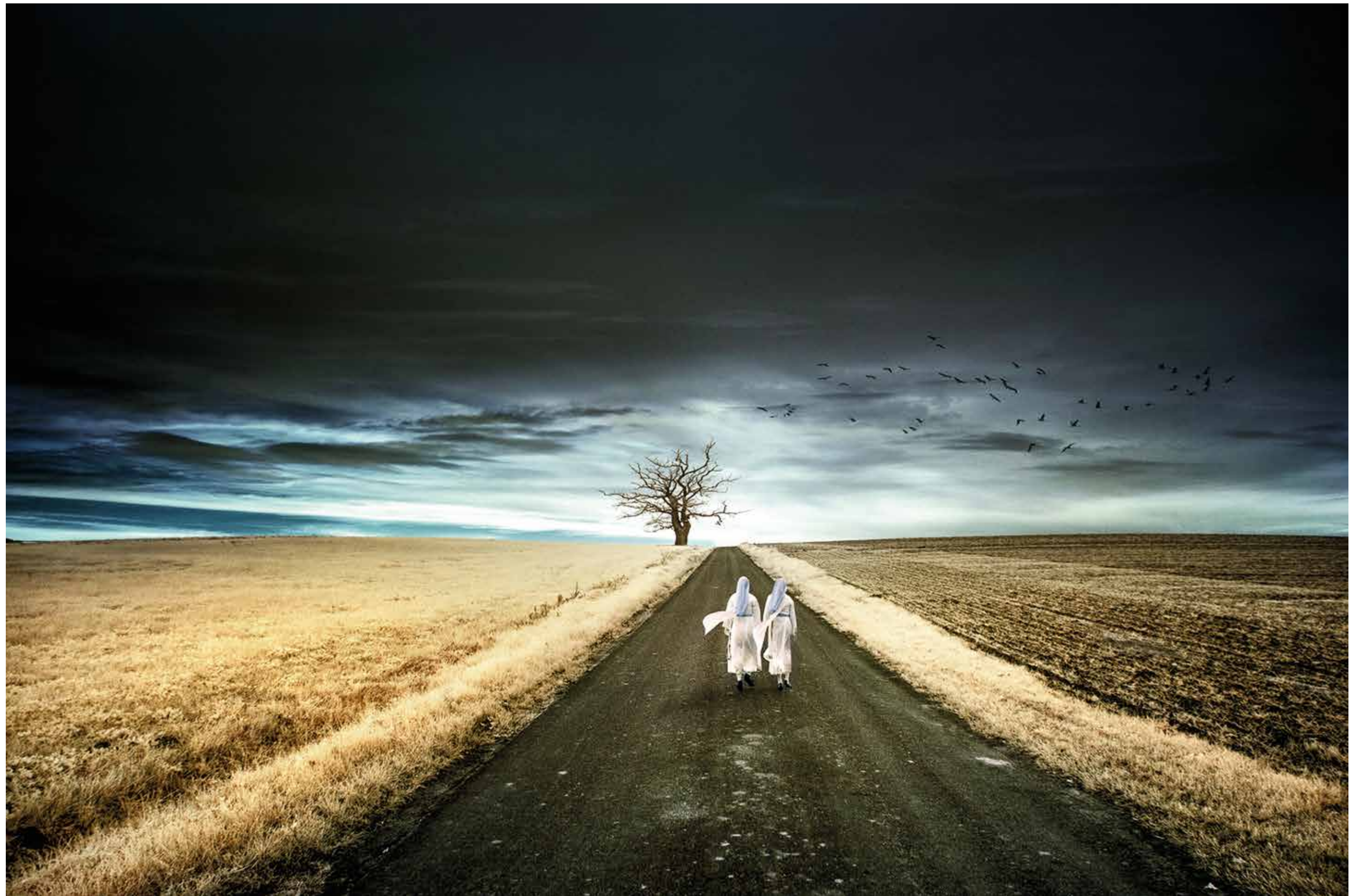
Fotografía: Camino largo Autor: Manh Ngoc Nguyen Año: 2015

“La foto fue tomada en noviembre de 2014 en una carretera del suburbio de Osnabrück, Alemania, con el infrarrojo de la cámara. Con esta imagen quería describir algo acerca de la misión de las monjas, ellas tienen un largo camino en la vida. Ellas van por el camino con su fe y que siempre siguen la luz hacia el horizonte”.