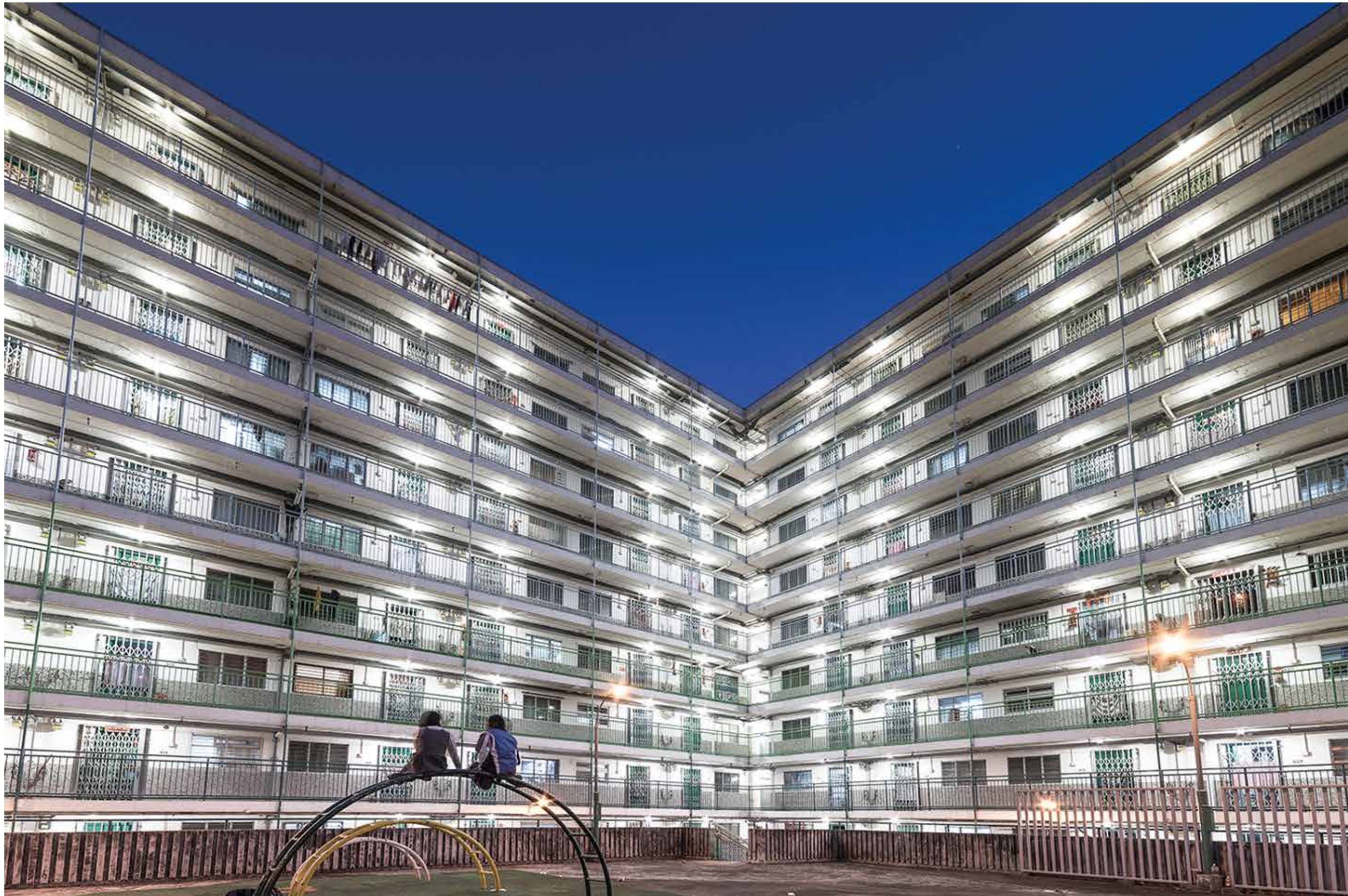
Fotografía: Salad days Autor: Desmond Pang Año: 2015

"Incluir a estos jóvenes en la foto no era parte del plan, pero se quedaron allí por un largo período de tiempo, así que decidí capturarlos como parte de la imagen para evitar perder la hora azul. Así encontré más armonía que mostrando solo el edificio".