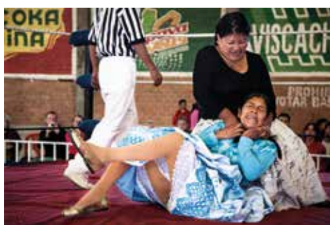
Año: 2015