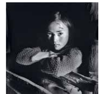
Fotógrafo: LI FAN, FOTÓGRAFO DEL AÑO LIFESTYLE Año: 2015

Serie: ETNIA YI, PERSONAS QUE VIVEN EN LAS GRANDES MONTAÑAS DE LIANGSHAN CHINA Al vivir en la Gran Montaña Liangshan, provincia de Sichuan en el suroeste de China, la etnia Yi ha experimentado un gran cambio social desde la sociedad esclavista a la sociedad socialista, luego de la fundación de la República Popular de China en 1949. En la profundidad de las Grandes Montañas de Liangshan, el desarrollo económico se basa en una agricultura autosuficiente y su forma de vida indígena es uno de los mejor conservados de las minorías étnicas en la región occidental de China. Copyright: © Li Fan / Lon Gallery, China, Winner, Lifestyle, Professional Competition, 2015 Sony World Photography Awards.