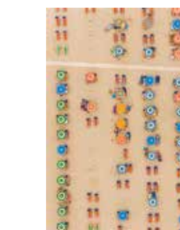
FOTÓGRAFO DEL AÑO TRAVEL Año: 2015