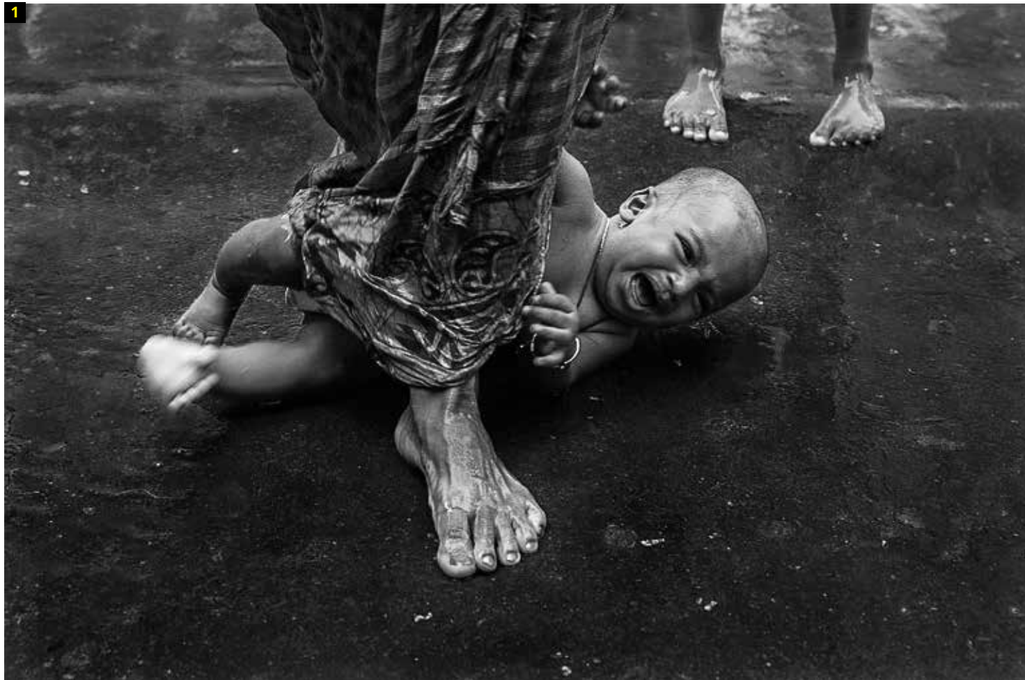
1 Fotografía: Pious steps. Autor: Amitava Chandra. País: India. Ganador de la categoría: India, National Award. Copyright: © Amitava Chandra, Winner, India, National Award, 2015 Sony World Photography Awards.