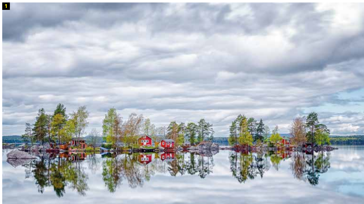
1 Fotografía: Mirror Lake. Autor: Torsten Mühlbacher. País: Austria. Ganador de la categoría: Austria, National Award. Copyright: © Torsten Mühlbacher, Winner, Austria, National Award, 2015 Sony World Photography Awards.