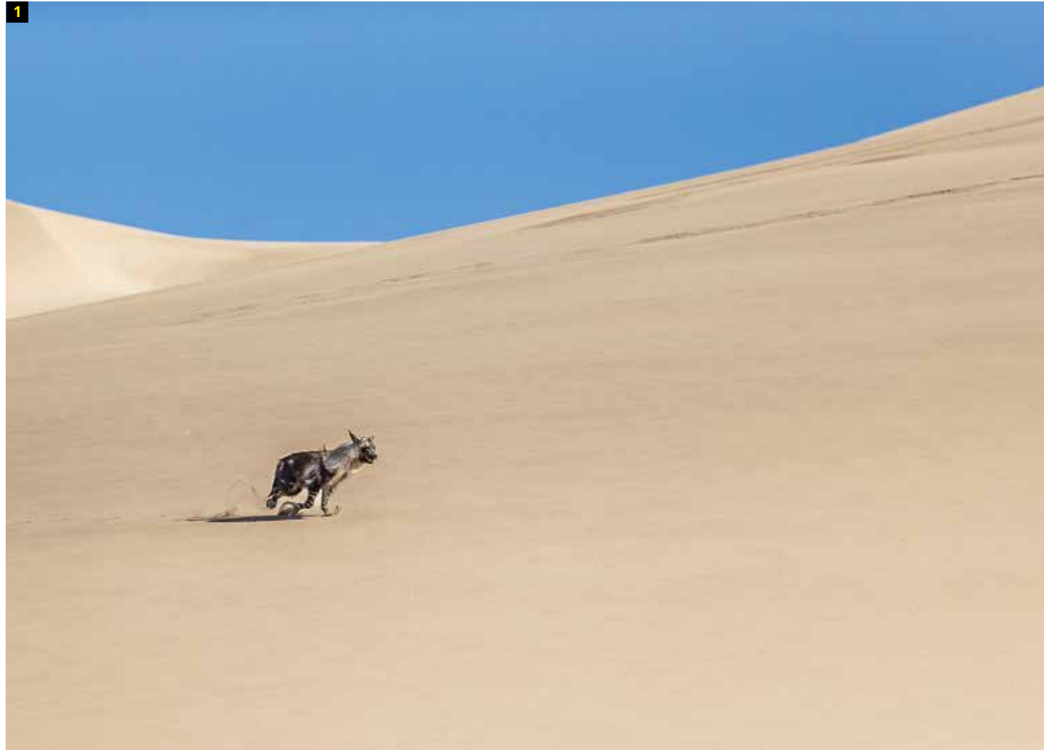
1 Fotografía: Strandwolf. País: Sur África. Ganador de la categoría: South Africa National Award.