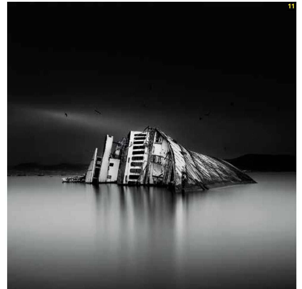
11 Fotografía: The Vessel. Autor: Vasilis Liappis. País: Grecia. Ganador de la categoría: 3rd place, Greece, National Award. Copyright: © Vasilis Liappis, 3rd place, Greece, National Award, 2015 Sony World Photography Awards.