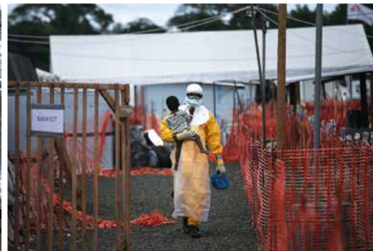
Año: 2015 Serie: LA CRISIS DEL ÉBOLA DESBORDA LA CAPITAL LIBERIANA En el verano de 2014 Monrovia, Liberia se convirtió en el epicentro de la peor epidemia del Ébola en la historia de África Occidental. Aunque los brotes anteriores fueron rurales, se propagaron fácilmente. Monrovia es conocida por su denso entorno urbano, a pesar de esto los resultados fueron descritos por Médicos Sin Fronteras como "catastróficos". Con una tradición de ritos funerarios que incluyen el lavado de los cadáveres de sus seres queridos, los liberianos se contagiaron a un ritmo alarmante.