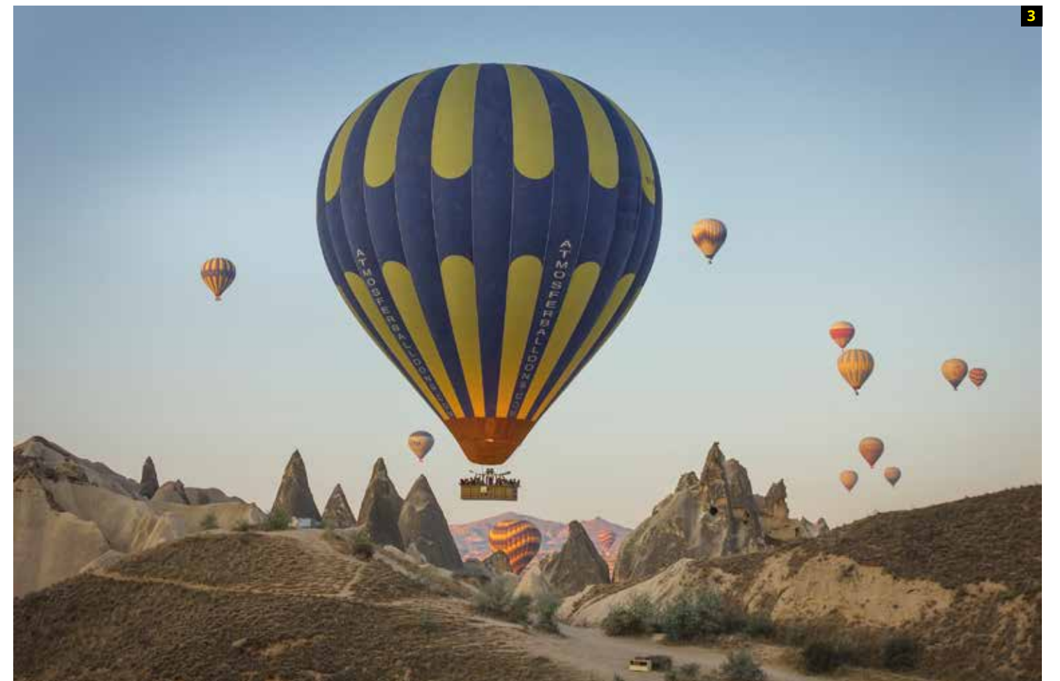
3 Fotografía: Goreme. Autor: Carloman Cespedes. País: Perú. Ganador de la categoría: Perú National Award. Copyright: © Carloman Cespedes, Winner, Perú National Award, 2015 Sony World Photography Awards.